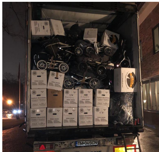
Camión procedente de Suecia

Elna Maternity nos ha entregado decenas de botes de leche infantil. Y Zaporeak ha donado una decena de palés de comida necesaria. Gracias por vuestro compromiso.