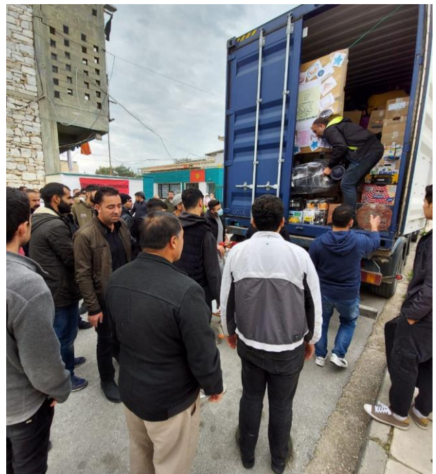
Descarga del contenedor en el campamento de LAVRIO