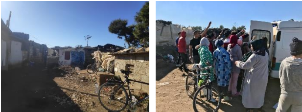
Envío y reparto de cuatro palés con ayuda humanitaria en el campamento de Atochares, Níjar (Almería)