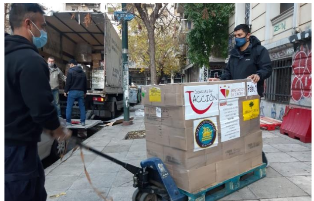
Descarga del contenedor financiado por Sonrisas en Acción

En los primeros días de enero descargamos en nuestro almacén los palés donados por Sonrisas en Acción, de Cáceres, que habían llegado a El Pireo unos días antes. Buen trabajo, compañeras, gracias por vuestra solidaridad una vez más.