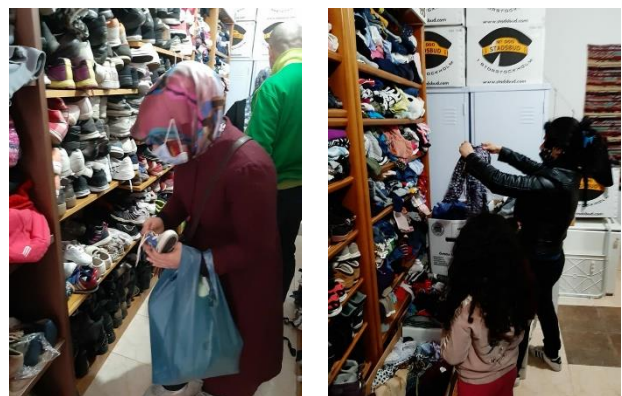
Nueva Free Shop de SOS en la que con cita previa y guardando todas las medidas de seguridad, se permite el acceso para buscar lo que las familias refugiadas necesitan.

Desde hace unos días tenemos abierta varias horas al día una Free Shop, después de acondicionarla, limpiarla, pintarla y dotarla de estanterías. En este local, con la ropa, el calzado y otros artículos de primera necesidad ordenados y a la vista, decenas de familias vulnerables vienen a diario para buscar esa prenda o esa silla de bebé que, en un reparto masivo en los campos o en la calle no se puede entregar. Debidamente registrados y a la hora convenida entra un miembro de la familia y dispone de un tiempo para elegir aquellas prendas o artículos que necesita. De esta manera, conseguimos evitar que a las puertas del almacén se formen tumultos de personas pidiendo esto o aquello y que la policía nos deje tranquilas y no tenga que intervenir.