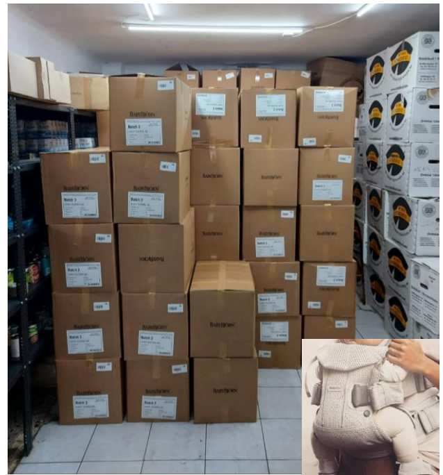
En la nueva Freeshop de SOS REFUGIADOS se repartirán los portabebés.

Además, la ONG The Health Impact ultima en Madrid la campaña de recogida de material de primeros auxilios, higiene y leche infantil en la que han colaborado muchos grupos y amigos de la capital y de otras ciudades y pueblos cercanos. SOS Ibiza , SOS Salamanca , Premià de Mar, Léliana Refugianostrum y el IES El Foix de Santa Margarida i els Monjos, Barcelona, están en plena recogida de comida y material de primera necesidad. Muchas gracias a tod@s.