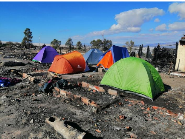
Las tiendas que mandamos en el primer envío se utilizaron tras quemarse muchas de las chabolas.