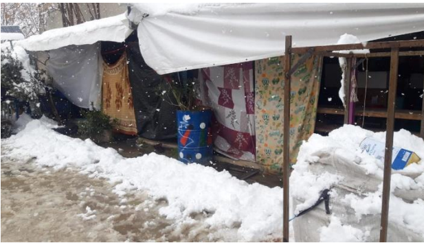
La nieve ha llegado. Fotos 16 y 18 febrero 2021. Campo de Eleonas.