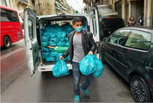
Decenas de bolsas preparadas para repartir. 11 de febrero.

2HelpingHands ha plantado en Atenas un tráiler entero de portabebés. Un abrazo lleno de agradecimiento.