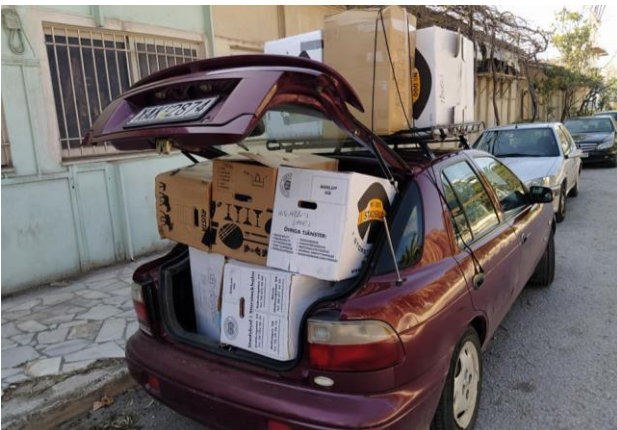
Preparando un envío.