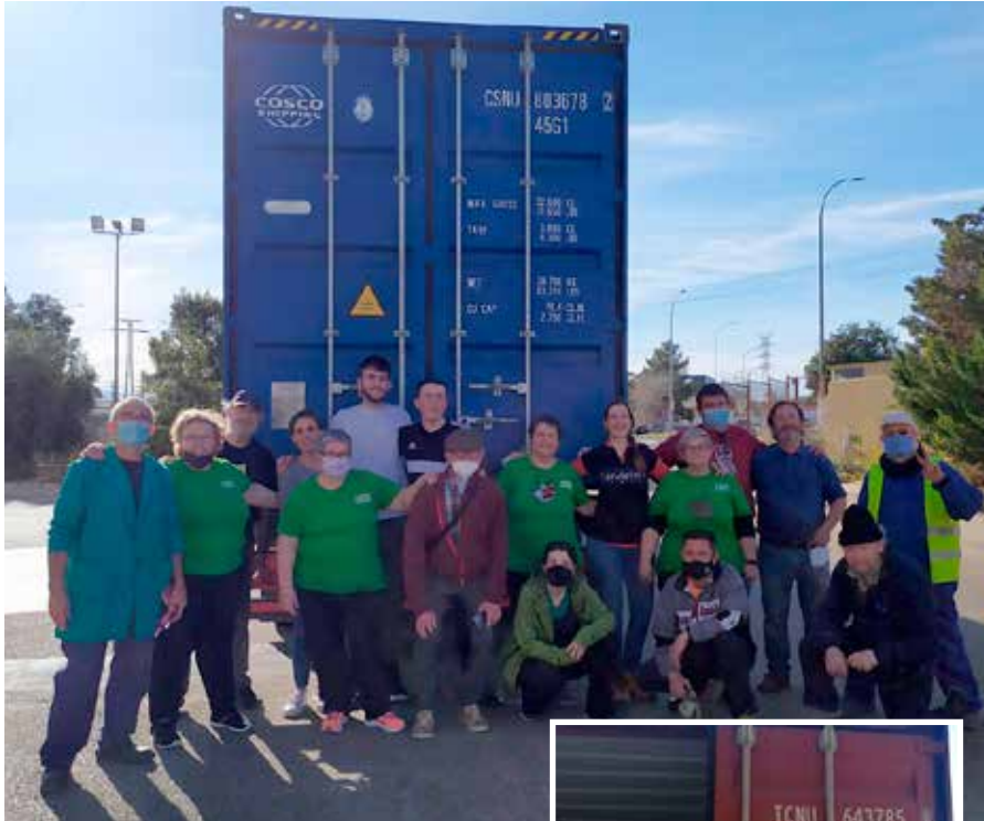
Carga del contenedor de Caudete se mueve (arriba) y carga del contenedor de Ibiza (derecha)

El contenedor N° 131 llegó el 15 de enero a Atenas.