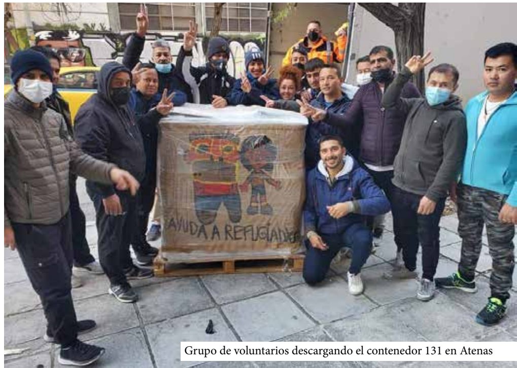
Grupo de voluntarios descargando el contenedor 131 en Atenas

Lo único inamovible es el objetivo del cuidado y la atención a quienes más lo necesitan.