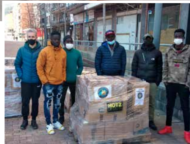
Palés de Hotz Legazpi en el almacén de Valencia preparados para la próxima carga del contenedor 134, y grupo de voluntarios de Hotz en origen.

paletiza, llega y se reparte sin terceras personas ni intermediarios.