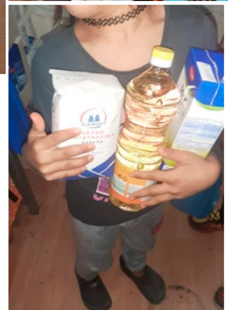
Descarga del contenedor de Caudete se Mueve (arriba-izquierda) y carga de la furgoneta para reparto (arriba-derecha) niña con algunos alimentos entregados (abajo-derecha)