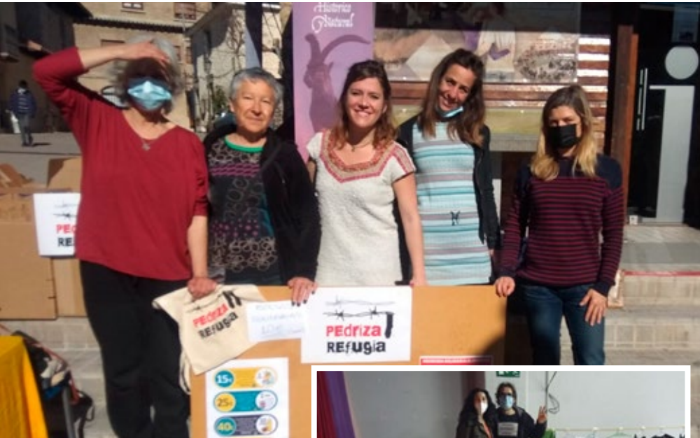
Recogida de material humanitario de Pedriza Refugia (arriba) Mesa de SOS Refugiados Guindalera en cena solidaria con Bicicrítica (derecha) y grupo de voluntarias tras carga de camión de Seur en Guindalera (Abajo)