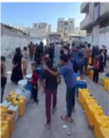
Reparto de agua en Gaza

También hicimos una aportación para comprar comida en el interior de Gaza, pero el aislamiento más absoluto ha hecho dispararse el coste enormemente. Biriyani ha enviado y repartido 60 camiones de agua. Probablemente sigamos con ese proyecto dado que el agua está siendo un bien preciado.