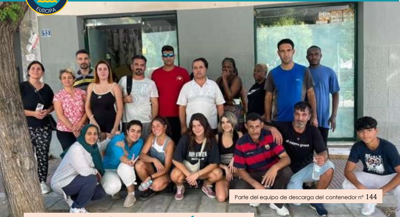
Parte del equipo de descarga del contenedor nº 144