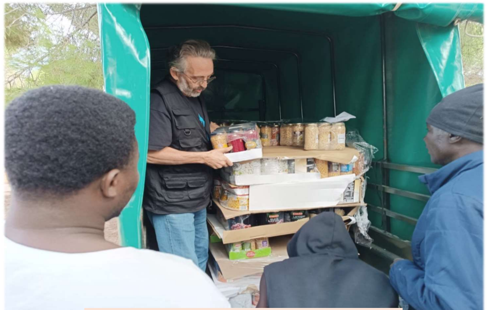
Reparto de Legumbres Penelas en Asnuci y La Carpa, campos de temporeros