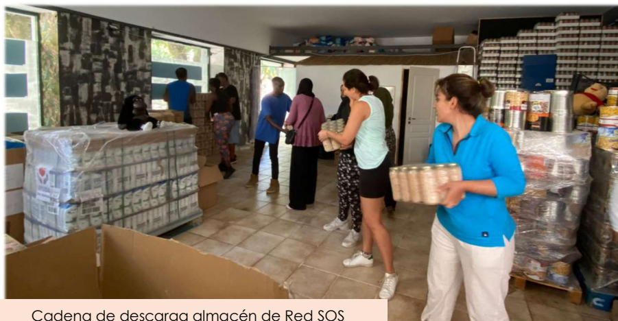
Cadena de descarga almacén de Red SOS

Necesitamos que os suméis a esta campaña de invierno de recogidas para seguir manteniendo el ritmo de repartos.