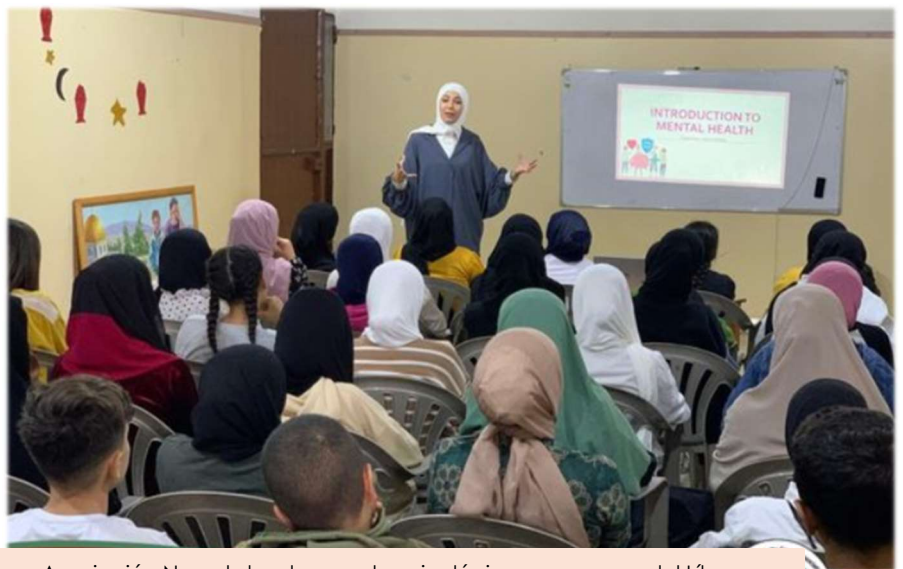
Asociación Nuwat dando soporte psicológico en campos del Líbano

apoyo a los desplazados de la zona sur del país. Nuwat , coordinando la compra, reparto y monitoreo del proceso y RSRE , como ong donante, hemos firmado un acuerdo para iniciar un proyecto humanitario destinado a apoyar a 70 familias desplazadas (350 personas) , actualmente alojadas en el refugio de una escuela en Saida, al sur del Líbano . El