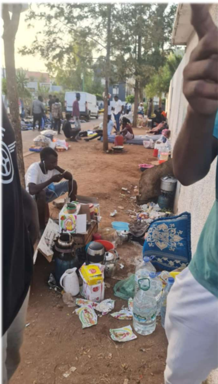
Comunidad sudanesa cocinando

En las páginas de nuestra web podéis acceder a información sobre nuestro trabajo, las diversas campañas de ayuda y los proyectos solidarios activos. Gracias a tod@s.