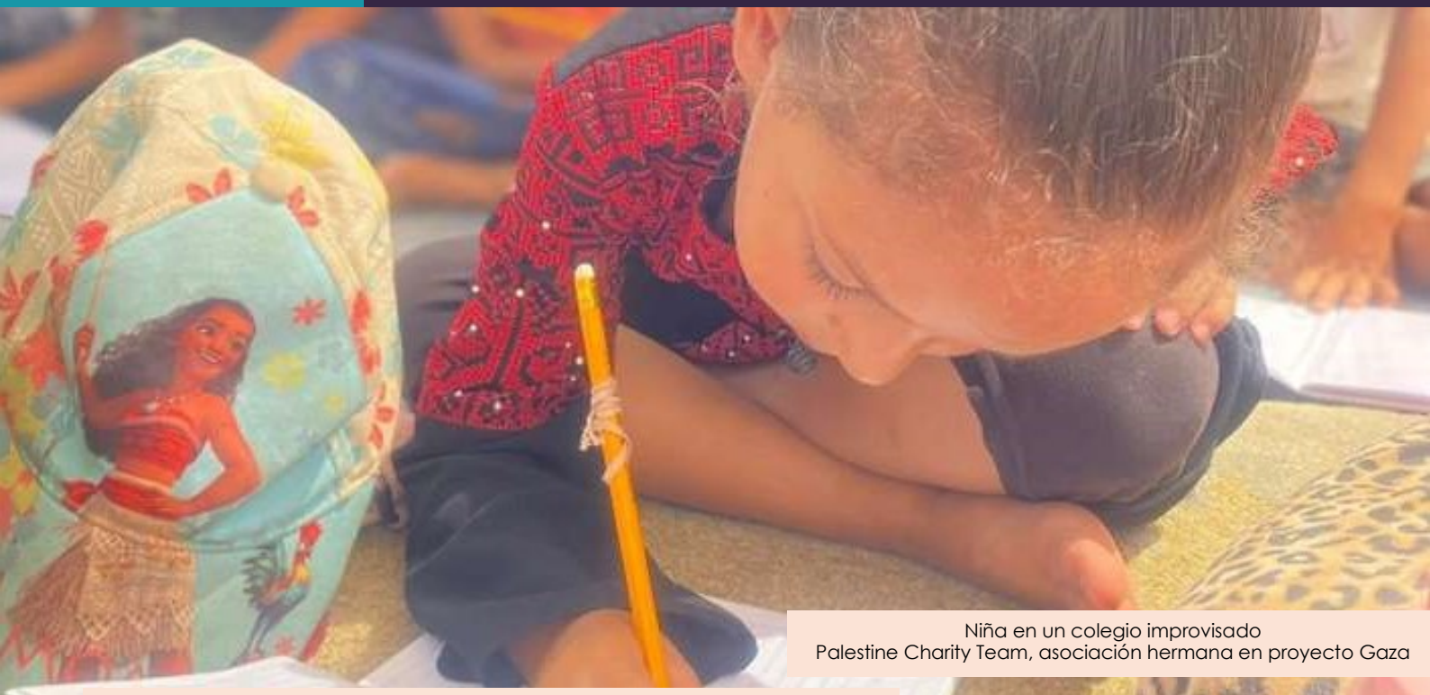
Niña en un colegio improvisado Palestine Charity Team, asociación hermana en proyecto Gaza