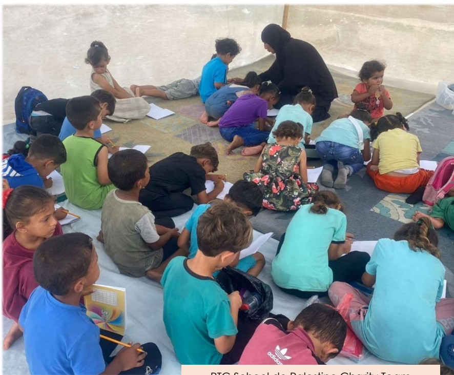
PTC School de Palestine Charity Team