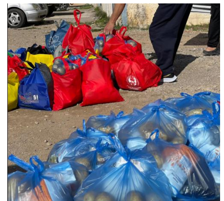
Reparto en el campamento de Tebas junto a Christian Refugee Relief.

ONG Christian Refugee Relief , gracias a la cual hemos podido ampliar nuestra actividad al campo de refugiados de Tebas . Durante estos dos meses, hemos registrado a más de 200 familias que ahora reciben atención y apoyo cada