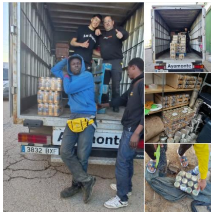
Recepción en ASNUCI de la donación de Legumbres Penelas enviadas desde el almacén de Red SOS Refugiados Europa

y protegen a los jornaleros migrantes de varios municipios a quienes las autoridades responsables siguen sin ofrecer alternativas habitacionales dignas, viéndose abocados a vivir en chabolas que sufren incendios de manera regular.