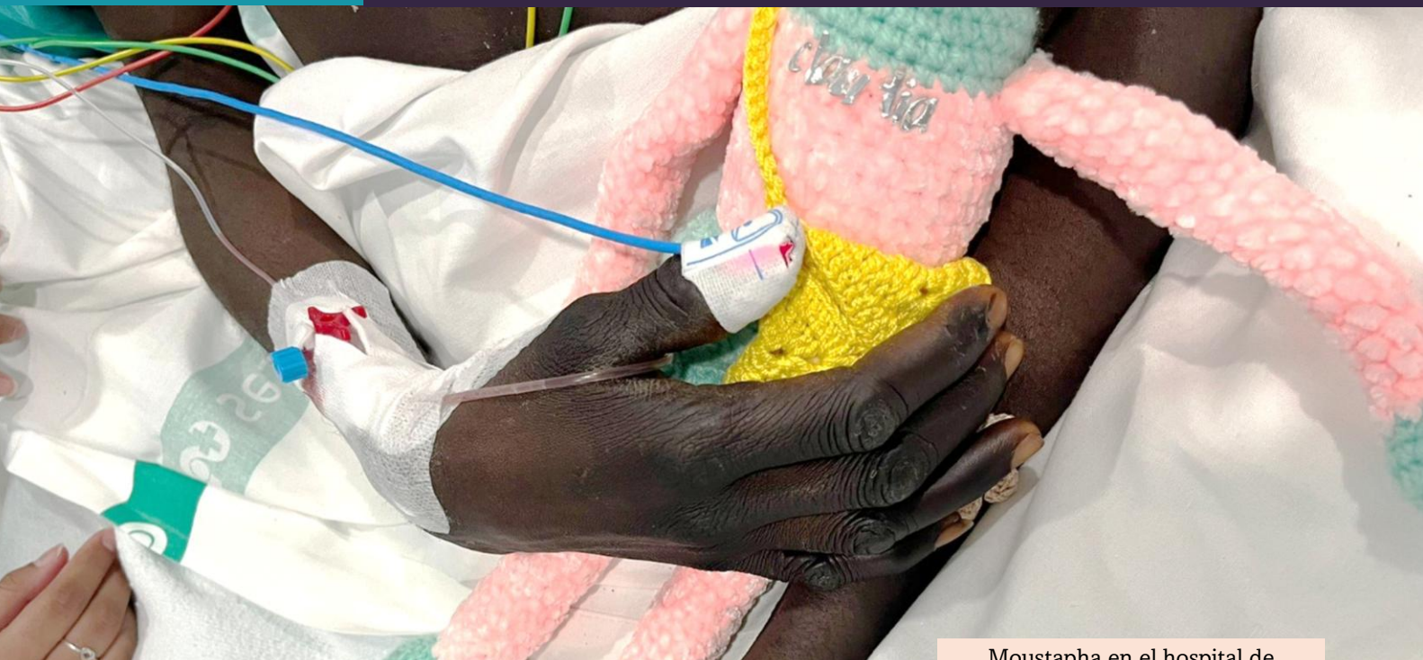
Moustapha en el hospital de Albacete