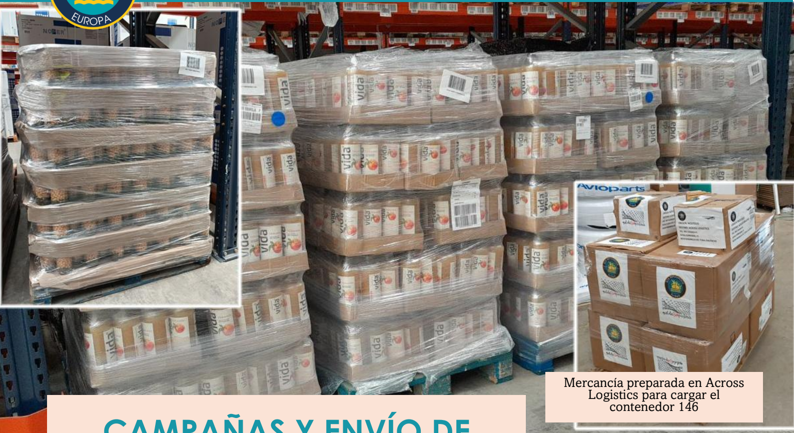
Mercancía preparada en Across Logistics para cargar el contenedor 146