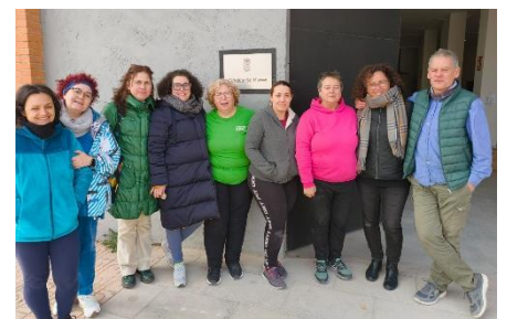
Equipo de voluntarias para la carga del contenedor 145 enviado en enero 2025

2. Caudete se Mueve. El 2 de enero realizamos la carga del contenedor que enviamos a Atenas. Estos han sido los grupos colaboradores: PAR de Almansa; Colectivo Sin Fronteras de Albacete; Ayuda a Personas Refugiadas de Elche; Grupo Abril de Elda; Huerto Carolinas de Alicante; Sonrisas y cometas de Alicante; Asociación de Vecinos