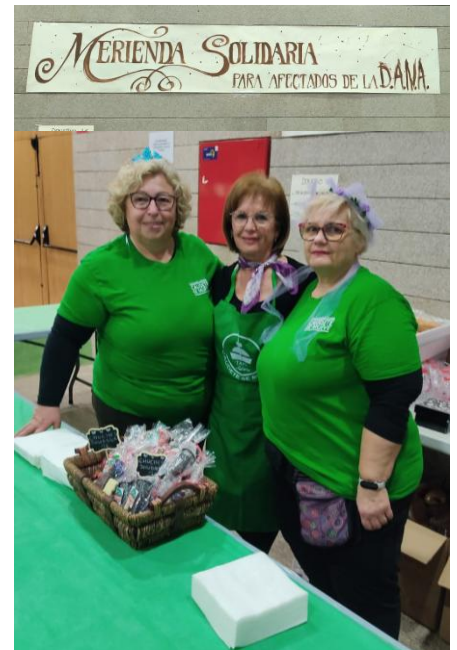
Merienda solidaria de Caudete se Mueve

2. Caudete se Mueve. El 2 de enero realizamos la carga del contenedor que enviamos a Atenas. Estos han sido los grupos colaboradores: PAR de Almansa; Colectivo Sin Fronteras de Albacete; Ayuda a Personas Refugiadas de Elche; Grupo Abril de Elda; Huerto Carolinas de Alicante; Sonrisas y cometas de Alicante; Asociación de Vecinos