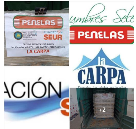
Post en redes de agradecimiento de la asociación La Carpa por las Legumbres Penelas recibidas.

A pesar de las reiteradas denuncias de las organizaciones sociales sobre las condiciones inhumanas en estos asentamientos, las Administraciones públicas siguen sin actuar de manera efectiva. Los ayuntamientos continúan negando el derecho a empadronamiento de estas personas mientras que la Junta de Andalucía lleva meses difundiendo un plan para la erradicación de asentamientos que no está aún elaborado y del que solo se conocen declaraciones en prensa” (leer noticia en siguiente sección).