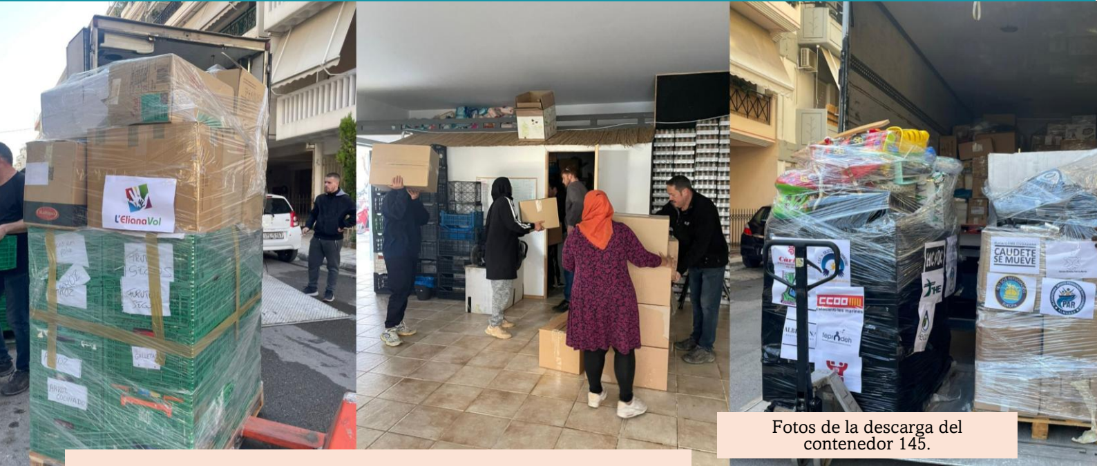
Fotos de la descarga del contenedor 145.