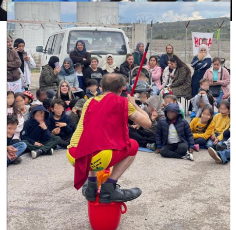
El payaso Super Tayi en sus actuaciones en los campamentos de Ritsona y Malakasa.

En el campo de Malakasa hemos seguido, aunque de forma intermitente por mal tiempo, con nuestras actividades infantiles. Estas sesiones son un espacio de encuentro, aprendizaje, solidaridad y juego para los niños y niñas que viven en el campo, y representan un respiro de alegría en un entorno que sigue siendo profundamente hostil. Estamos convencidas de que, con la llegada de la primavera, podremos retomar estas actividades de manera semanal y seguir ofreciendo a la infancia refugiada un espacio