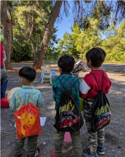
Intentamos que los niños también tengan su “vuelta al cole” con mochilas y materiales de dibujo.

NUESTRA ACTIVIDAD EN ATENAS se mantiene de manera constante y regular. Cada día, nuestros equipos se desplazan a los campos de Malakasa, Ritsona, Tebas e Inovita, y de forma puntual también al campo del Lavrio, cuando la comunidad que allí reside nos pide apoyo directo.