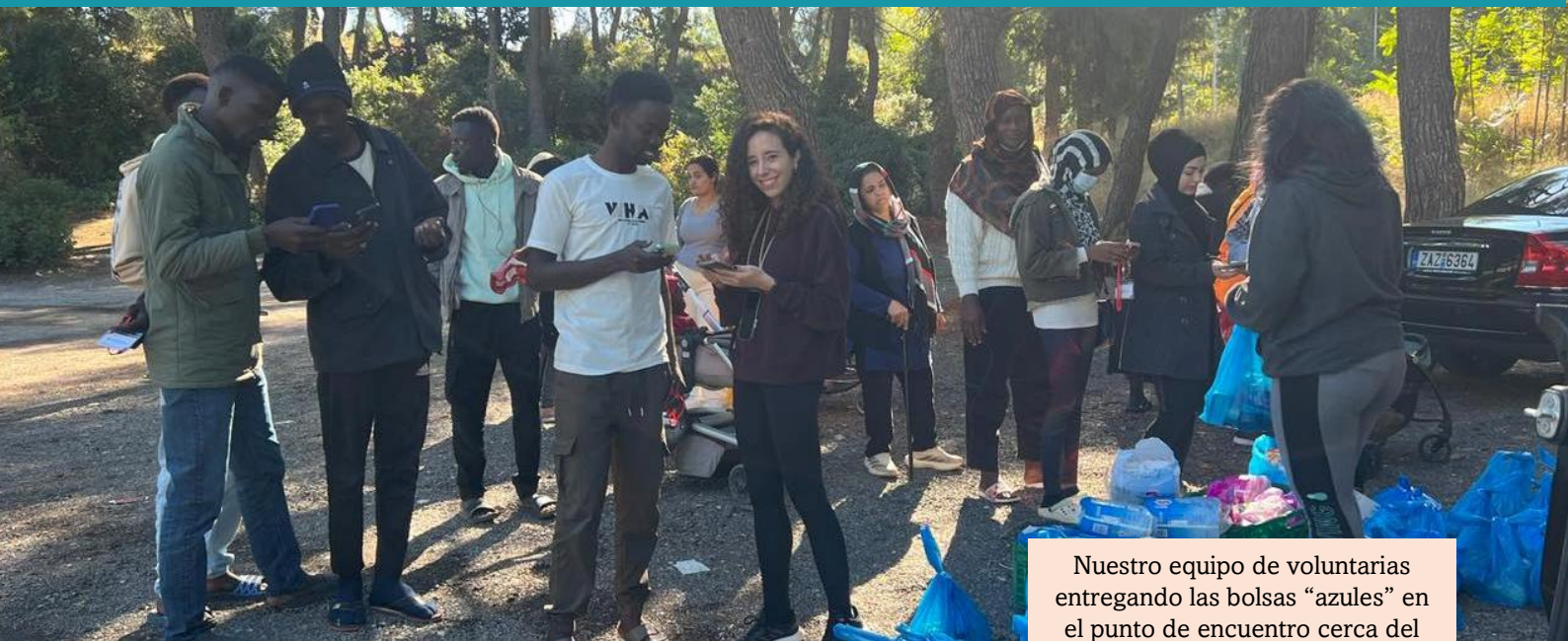
Nuestro equipo de voluntarias entregando las bolsas “azules” en el punto de encuentro cerca del campo de Malakaasa.