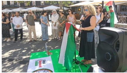
Acto de lectura del nombre de las niñas y niños palestinos asesinados en el genocidio de los dos últimos años en la Franja.

6. SOS Refugiados Navalcarnero. Participamos, junto con otros colectivos, en el acto de solidaridad "Stop Genocidio en Gaza".