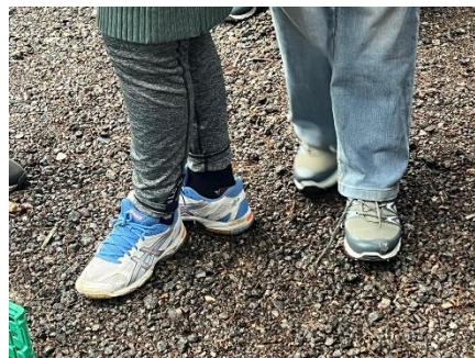
Las deportivas repartidas son estrenadas en el mismo momento que las reciben.

personas no tienen acceso ni siquiera a un calzado básico. No es raro ver a hombres y mujeres caminando descalzos, o a niños jugando en chanclas entre el barro. Ahora, con el frío y las lluvias, las condiciones se vuelven aún más duras: los caminos se llenan de agua y barro, y los suelos dentro de los contenedores o tiendas se empapan con facilidad. Por eso, la llegada de cada par de zapatillas ha sido un verdadero regalo, una señal de que alguien, en algún lugar, piensa en ellos y se preocupa.