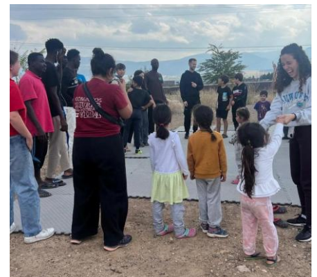
Sesión de Hip Hop 4 Hope

Cada semana, después de nuestros repartos de alimentos, los jóvenes del campo se reúnen para bailar, rapear y compartir un espacio de energía, expresión y libertad.