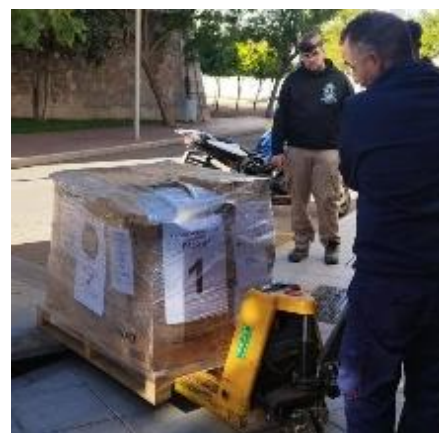
Plan Mafalda cargando 5 palés de juguetes