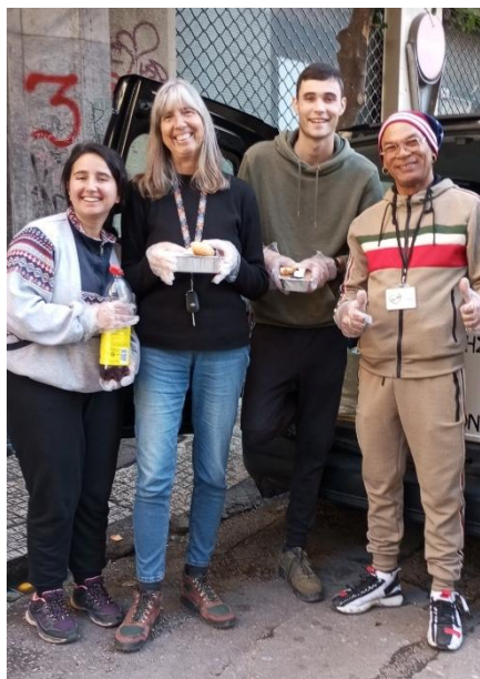
Reparto de comida caliente con HYN.

3. En Atenas continuamos colaborando con diversas organizaciones amigas ampliando la red de ayuda mutua.