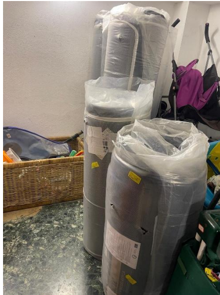
Colchones ofrecidos por Fundación Seur

2. Seguimos enviando ayuda a asociaciones de apoyo a trabajadores migrantes en Huelva , personas que contribuyen significativamente a la economía de la zona, pero a quienes se les niegan derechos básicos y que se ven obligados a vivir en poblados chabolistas, infraviviendas siempre a merced del tiempo, los incendios y las inundaciones. Por fin pudo hacerse entrega del envío de colchones y ropa de vestir.