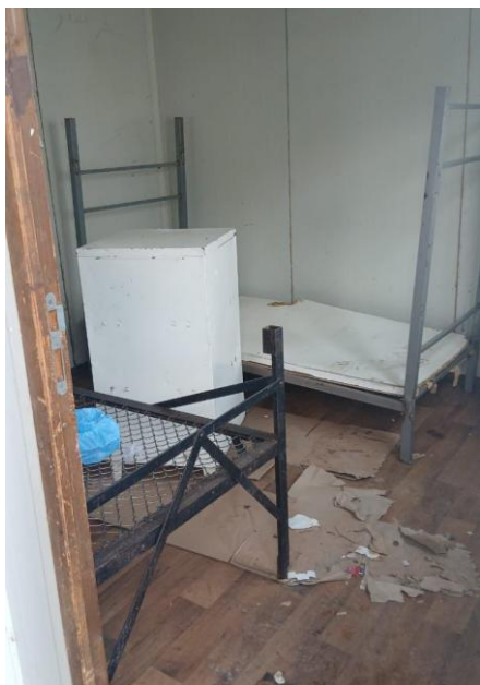
Contenedores del campamento de Malakasa

A ello se suma la deficiente calidad de los contenedores y alojamientos, muchos de los cuales presentan agujeros en paredes, problemas de aislamiento y un